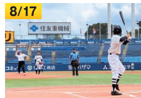
8/17 全国高等学校定時制通信制軟式野球大会始球式