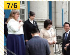
死刑廃止議論意見交換会(英国大使館)