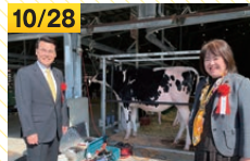
第41回兵庫県酪農祭(淡路市)