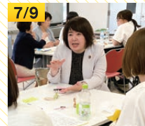
ウィメンズトーク(洲本市)