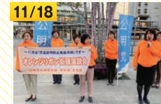
オレンジリボン街頭(姫路市)