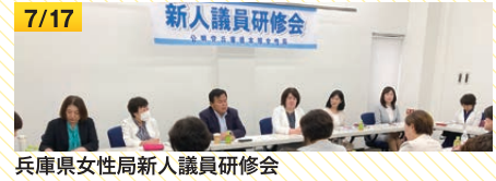
兵庫県女性局新人議員研修会