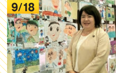
全国おじいちゃんおばあちゃん子ども絵画展表彰式(多可町)