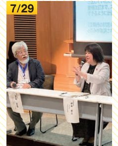
日本ストレスマネジメント学会第21回大会にて講演(東京・新宿区)