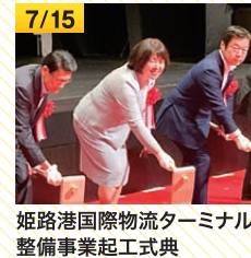
姫路港国際物流ターミナル整備事業起工式典