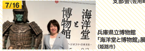
兵庫県立博物館「海洋堂と博物館」展(姫路市)