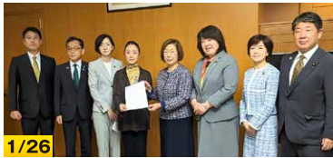
1/26 公明党教育改革推進本部