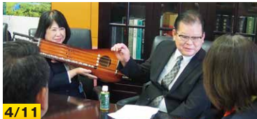
4/11 沖縄で誕生した楽器「琉球かれん」開発者