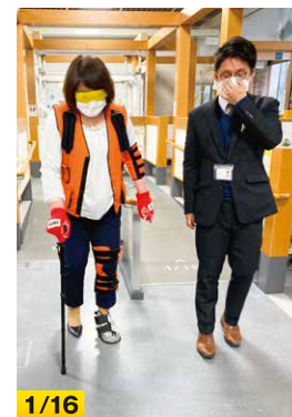
1/16 福祉用具専門相談員の方と高齢者・片まひを疑似体験