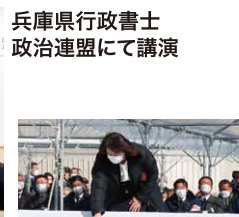
1/17 「1.17のつどい」にて献花