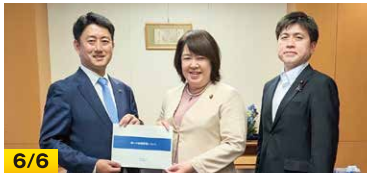
6/6 松本眞尼崎市長・中野衆議院議員