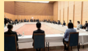
男女共同 参画会議 (総理官邸) 12/15