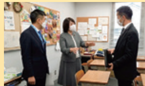
埼玉県 戸田市教育 支援センター すてっぷ 12/13