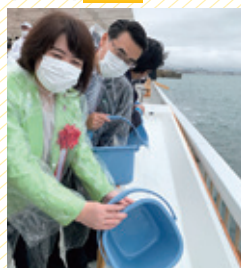
第41回全国豊かな 海づくり大会兵庫大会 (明石市) 11/13