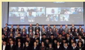
世界津波の日 2022高校生 サミットin新潟 10/19