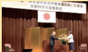
障害者の 生涯学習支援 活動に係る 文部科学大臣 表彰式 12/6