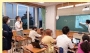
神奈川県 相模原市立 大野南中学校 分校夜間教室 9/28