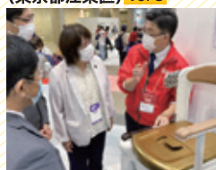
国際福祉機器展 (東京都江東区) 10/5