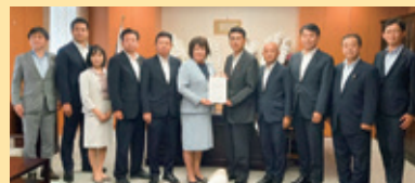
公明党兵庫県議団 9/9