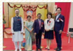
日印国交樹立 70周年記念 インドフェア (神戸市) 8/11