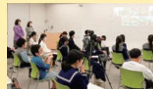
第9回福島県 双葉郡ふるさと 創造学サミット 12/3