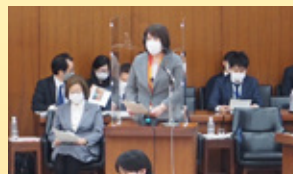
衆議院 文科委員会 答弁 11/9