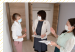
シングル マザーハウス With シェアハウス 内覧会(宝塚市) 10/1