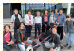
芸術文化観光 専門職大学 (豊岡市) 9/21