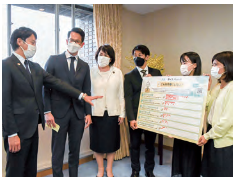
公明党の議員と青年党員の代表が齋藤兵庫県知事 (左端)にアンケート結果を提出(5月12日)