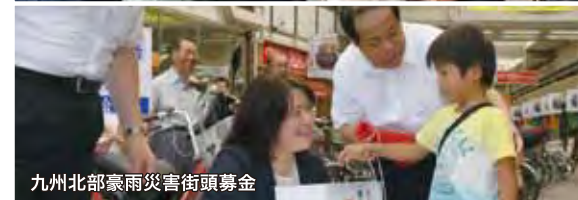
九州北部豪雨災害街頭募金