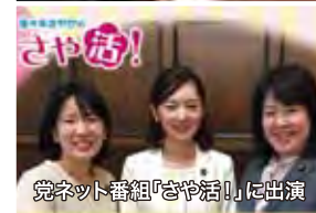
党ネット番組「さや活!」に出演