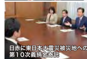
日赤に東日本大震災被災地への第10次義捐金寄託