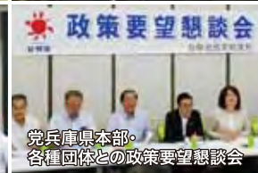
党兵庫県本部・各種団体との政策要望懇談会