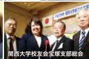
関西大学校友会宝塚支部総会