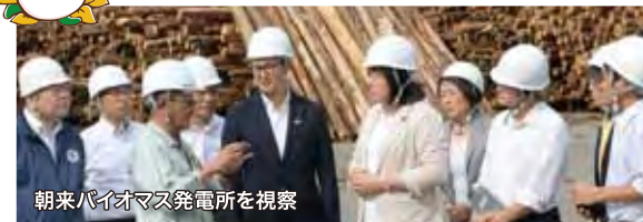
朝来バイオマス発電所を視察