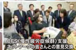
CFS(慢性疲労症候群)支援ネットワークの皆さんとの意見交換