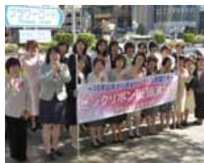
ピンクリボン(乳がん撲滅)月間 街頭演説会