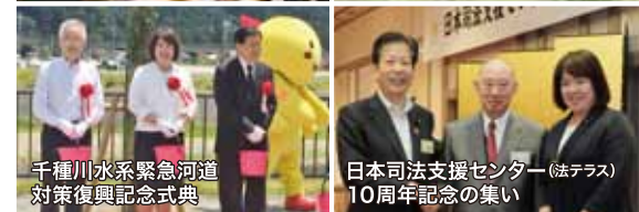
千種川水系緊急河道 対策復興記念式典