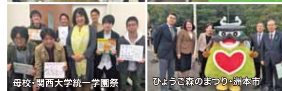
母校・関西大学統一学園祭